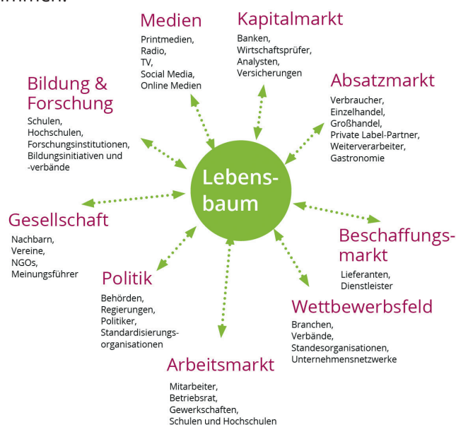
Anspruchsgruppen des Unternehmens Lebensbaum